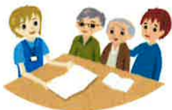
本人・家族の選択と心構え(自宅で誰にも見取られずに一人で死ぬ覚悟)

今回、市からの依頼により地域住民の利便性を考え、丸岡町の中心街に事務所を設置するよう準備を進めているところです。 実際の事業の開始は、平成28年4月からとなりますが、それまでには事務所を確定し人員を整えていく必要があります。現在その作業に追われています。